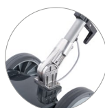
Snodo del manico