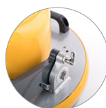
Sistema bloccaggio testata