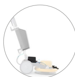
Spray system (optional)