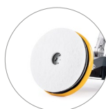
Vari tipi di pad