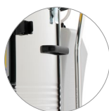
Serbatoio soluzione detergente