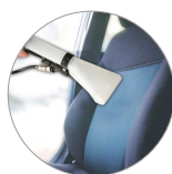
Ideale per ogni superficie