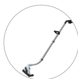
Bocchetta pavimenti estrazione (optional)