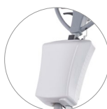
Serbatoio 12 litri