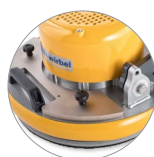
Possibilità uso pesi aggiuntivi (6,5 e 13 Kg)